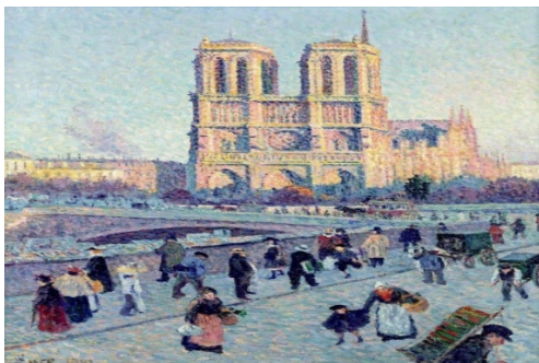
Maximilien Luce, Le Quai Saint-Michel et Notre-Dame, 1901