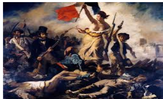
Eugène Delacroix, Le 28 Juillet. La Liberté guidant le peuple, 1831